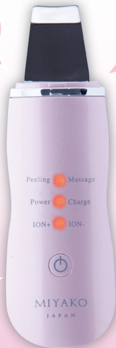
MIYAKO SERUM PEELING